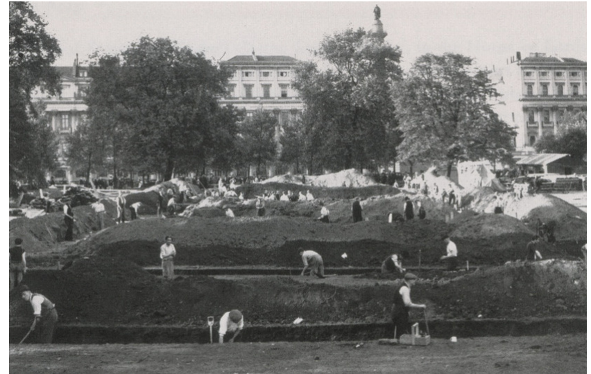
Excavación de trincheras refugio en St. James's Park, Londres, 1938.

Si "reservar" guarda, y "preservar" excluye, por tanto "desmantelar" embadurna el material antrópico sobre aquella materia en busca de su artificialidad. Produce un compromiso particular con el desmantelamiento exponencial de lo que es antrópico con el fin de alcanzar el grado máximo de artificialidad. El restablecimiento de la artificialidad pura en virtud de la extinción programática produce un nuevo pronóstico ético susceptible de ser analizado.