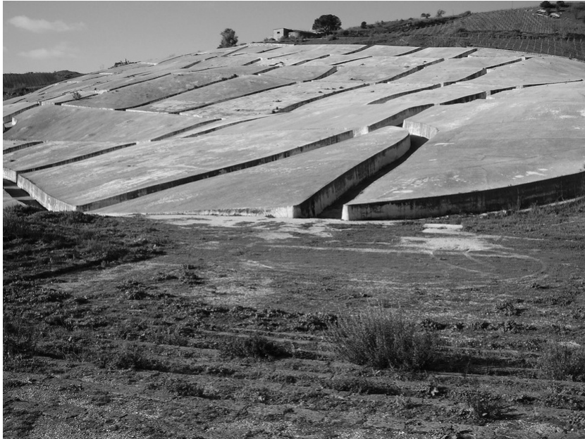
Alberto Burri, Il Grande Cretto , 1984-1989, 150×350000×280000 cm. Intervención en Gibellina, Sicilia, Italia.

"Tierra": el todo artificial "no natural". Un estado futuro en el que la producción total de material antrópico se subsume dentro de la masa planetaria. La búsqueda de la Tierra produce una madeja enredada indistinguible de materia artificial y material antrópico.